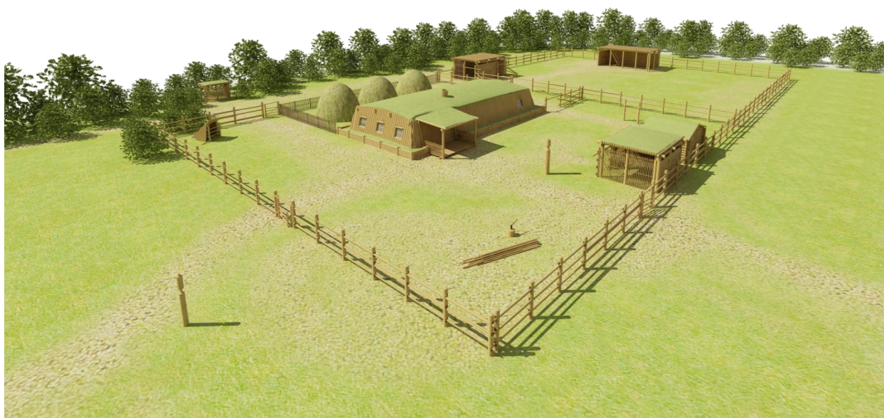
Рис.1. Архитектурный вид якутского балагана и других дворовых строений.

комплекса. Мы полагаем, что через эти строения можно определить умение народа приспособиться к суровым условиям северной природы, охарактеризовать его способности и возможности.