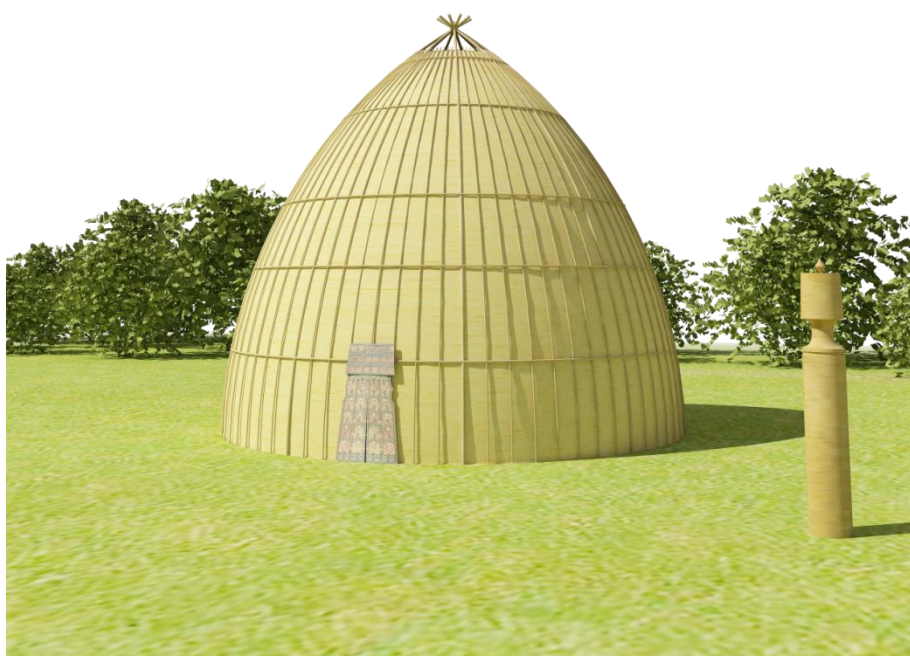
Рис. 3. Архитектурный вид берестяной урасы.

Он очень похож на восточный шатер, что подтверждает мнение выдающегося нашего современника Л. Н. Гумилева. «При миграциях народы стремятся выбрать географические условия ландшафта, как можно более напоминающие родину. Так, англичане не заселили ни Индию, ни тропическую Африку, ни Малакку и Саравак, оставаясь на положении колониальных чиновников, непосредственно не связанных с природой этих стран.